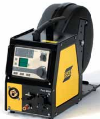
Origo™ Feed 4804