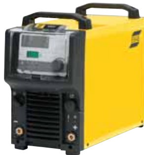
Origo™ Mig 4004i, A44

Выбирая режим управления напряжением дуги MIG/MAG, вы можете добиться лучшей производительности, и исключить гашение дуги.