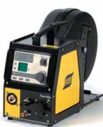
Origo™ Feed 3004