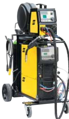
Источник с блоком охлаждения