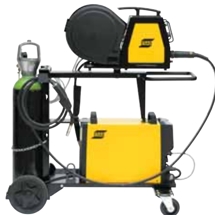
Источник без блока охлаждения